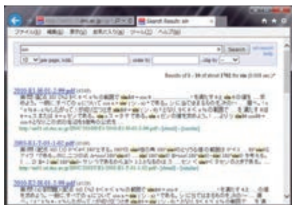
図 6 : 「sin」を入力とするキーワード検索

本システムでは全ての教科科目に対して、同一の手順で検索のインデックスを作成し、検索結果を返す。このため、検索キーワードとして「三角関数」を入力すれば、試験問題文に「三角関数」という文字列を含むファイルがヒットする。数式の一部である「sin」を入力すれば、数学の試験問題である PDF から「sin」なる文字列が切り出されるので、結果として「sin」なる文字列を含むファイルがヒットする（図 6）。LaTeX 形式による数式の検索はサポートしていない。