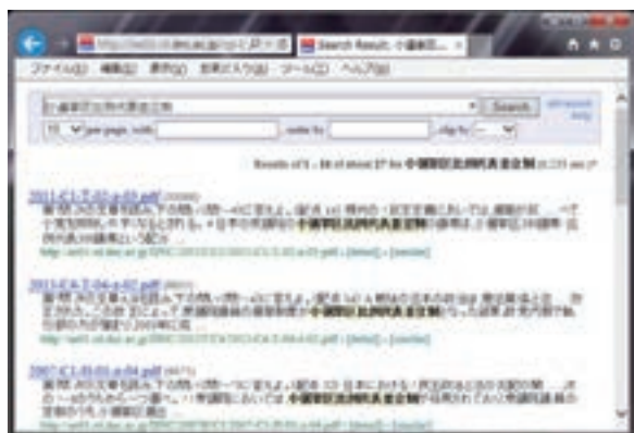
図 1：キーワード検索（「小選挙区比例代表立制」と入力）

国語の試験問題(PDF)は縦書きで作成されているが、この場合でも正しくキーワード検索されていることがわかる。