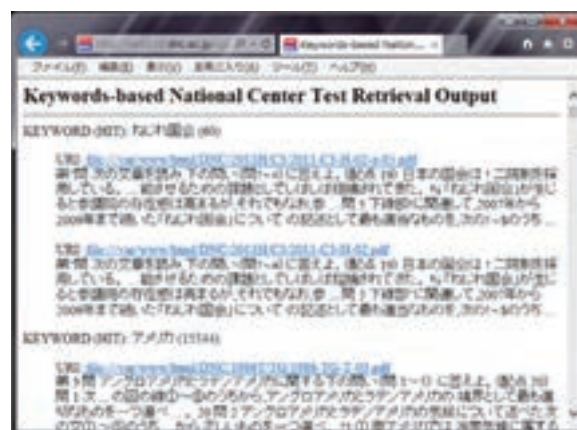
図5：関連文書検索の検索結果（「ねじれ国会」がキーワードとして抽出されている）

図5は、図4で指定した検索画面からの検索結果である。入力ファイルは、小選挙区比例代表並立制についての記述のある平成 25 年度の「現代社会」の試験問題である。このファイルから複数のキーワードが自動的に抽出される。ここでは、その最初のキーワードとして「ねじれ国会」が選ばれ、「ねじれ国会」に関連する試験問題として 2011 年の「政治・経済」の問題がヒットしている。