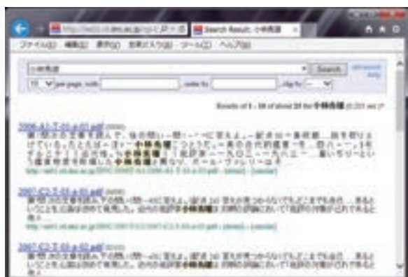
図 2：キーワード検索（「小林秀雄」と入力）

国語の試験問題(PDF)は縦書きで作成されているが、この場合でも正しくキーワード検索されていることがわかる。