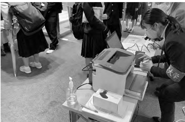
図 4. 試験当日の受付の様子

一方、新方式では、試験当日の受験者数を予想して試験室と試験監督者の数を設定しなければならない。過去の実績をみると受験率はおおよそ安定しているため(表 1 を参照)、実績ベースに若干余裕を持たせた予想受験者数を算出し 8) 、試験室と試験監督者数(予備監督者を含む)を割り出した。なお、受験生への周知は、ホームページでの周知及び受験連絡用のメール配信 9) のみを行ったが、試験終了まで本件に関する問い合わせはほとんどなかった。