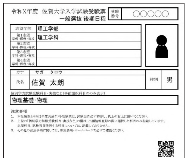
図1. QRコードを埋め込んだ受験票イメージ

佐賀大学では、試験当日の手続きにも電子情報を活用できる仕組みを検討し、受験票にQRコードを埋め込んで印刷できるように改修した(図1)。