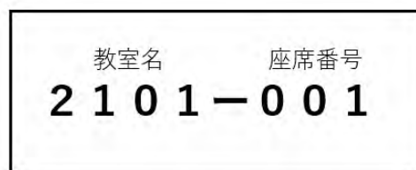
図3. 座席番号票のイメージ（紙で作成）

以上のように、「受付順配席方式」を実現するために、試験当日に設けた受付で受験票のQRコードを読み込み、試験室と受験座席を配置する方法について、本稿では「新方式」と呼ぶことにする。